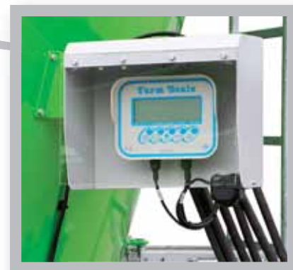
Pantalla de la báscula (opcional programable).