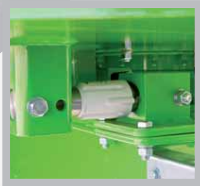
Tres células de pesaje.