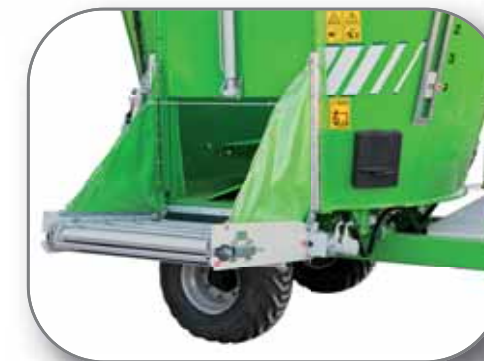
Cinta de descarga en puerta lateral con elevación hidráulica

con fibra larga. Tras años de experiencia en el sector TATOMA ha desarrollado un sinfín capaz de trabajar con cualquier tipo de mezcla garantizando la máxima homogeneidad y una distribución ideal. La espiral inferior de gran diámetro nos asegura una descarga regular cualquiera que sea el tipo de mezcla. A su vez la combinación entre el paso de las espiras y el diámetro de las mismas nos garantiza un perfecto movimiento del producto, un corte rápido y eficiente, un bajo consumo de combustible y un vaciado completo y regular de la cuba.