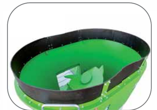
Anillo antidesbordamiento de goma